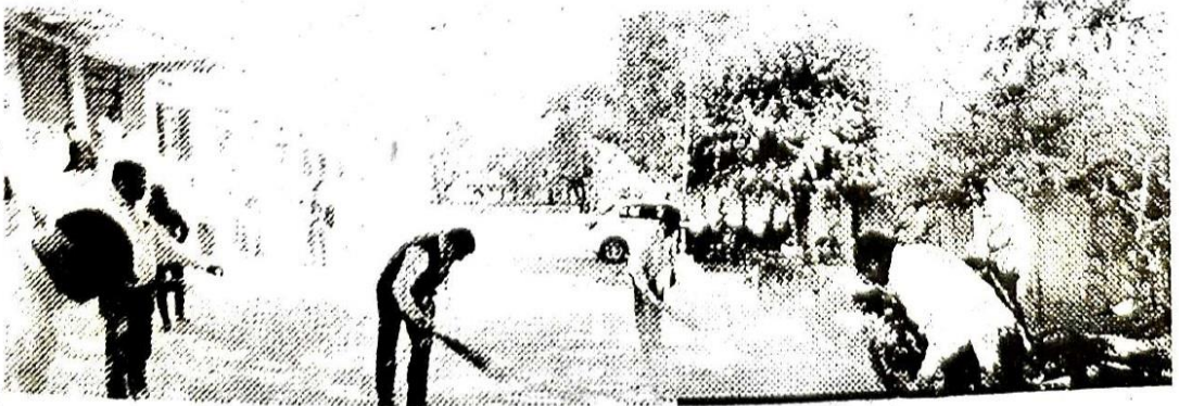
Mahatma Gandhi Vidyamandir Arts and Commerce College celebrated Sant Gadge Baba Jayanti by organizing a cleanliness campaign in collaboration with the National Service Scheme and Student Development Board.